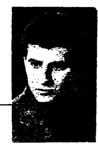
مع السلامة يا صاحب الجلالة لا نريد ان نديمك شيئا!